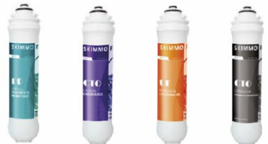
1º Etapa CA-0218-03 2º Etapa CA-0218-05 3º Etapa ME-0218-04 4º Etapa CA-0218-06