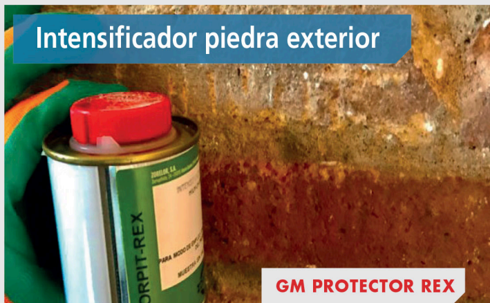
GM PROTECTOR REX

Intensificador de tono hidrofugante para piedra natural de baja porosidad, otorgando un aspecto mojado a superficies poco porosas como: mármol, granito, pizarra o piedra natural tanto en interiores como en exteriores.